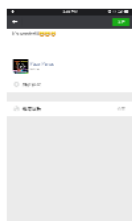
Share & Display