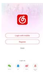
Login & Register